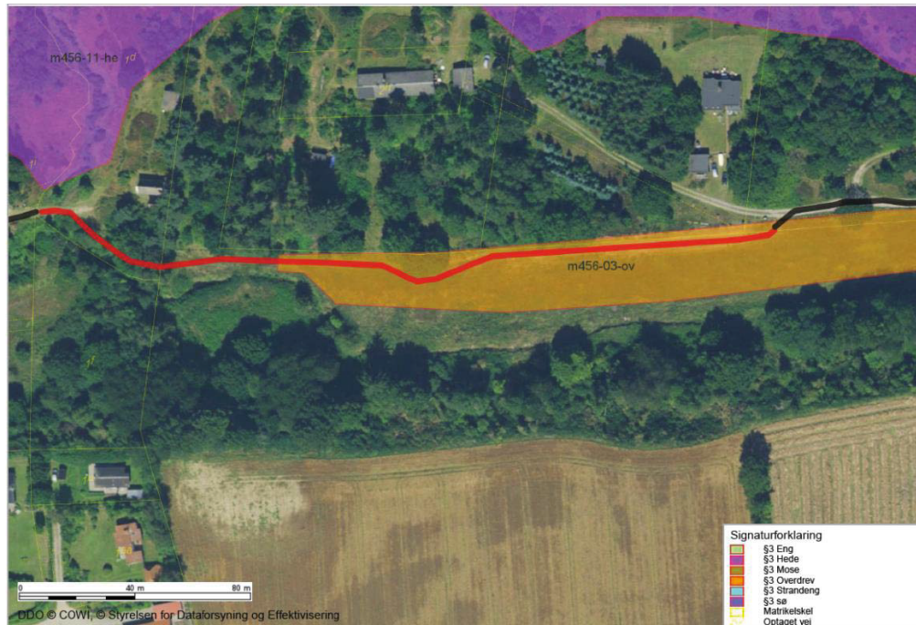
Figur 1. Linjeføringen af stien (sort og rød streg) krydser et overdrev, der er beskyttet af Naturbeskyttelseslovens § 3.