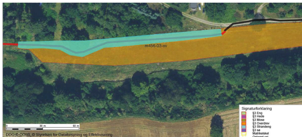
Figur 2. Linjeføring af stien (sort og rød streg) i et § 3-naturareal. Området, der blev besigtiget d. 25. august 2016 er markeret med turkis.

Helt generelt for det besigtigede område, ligger det lidt højere og er noget mere tørt end området lige syd for, se Figur 3.