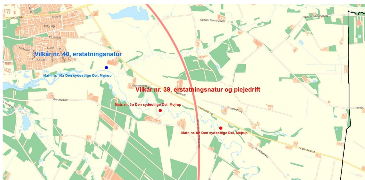
Kort 1. Den blå prik viser området, hvor erstatningsnatur skal etableres på matr. nr. 10 Den sydøstlige Del, Mejrup jf. vilkår nr. 40 i VVM-tilladelsen. De røde prikker viser områder, hvor erstatningsnatur og

På kortene herunder se de områder, hvor ansøger har indgået aftaler med lodsejer til imødekommen af vilkårene 39-42: