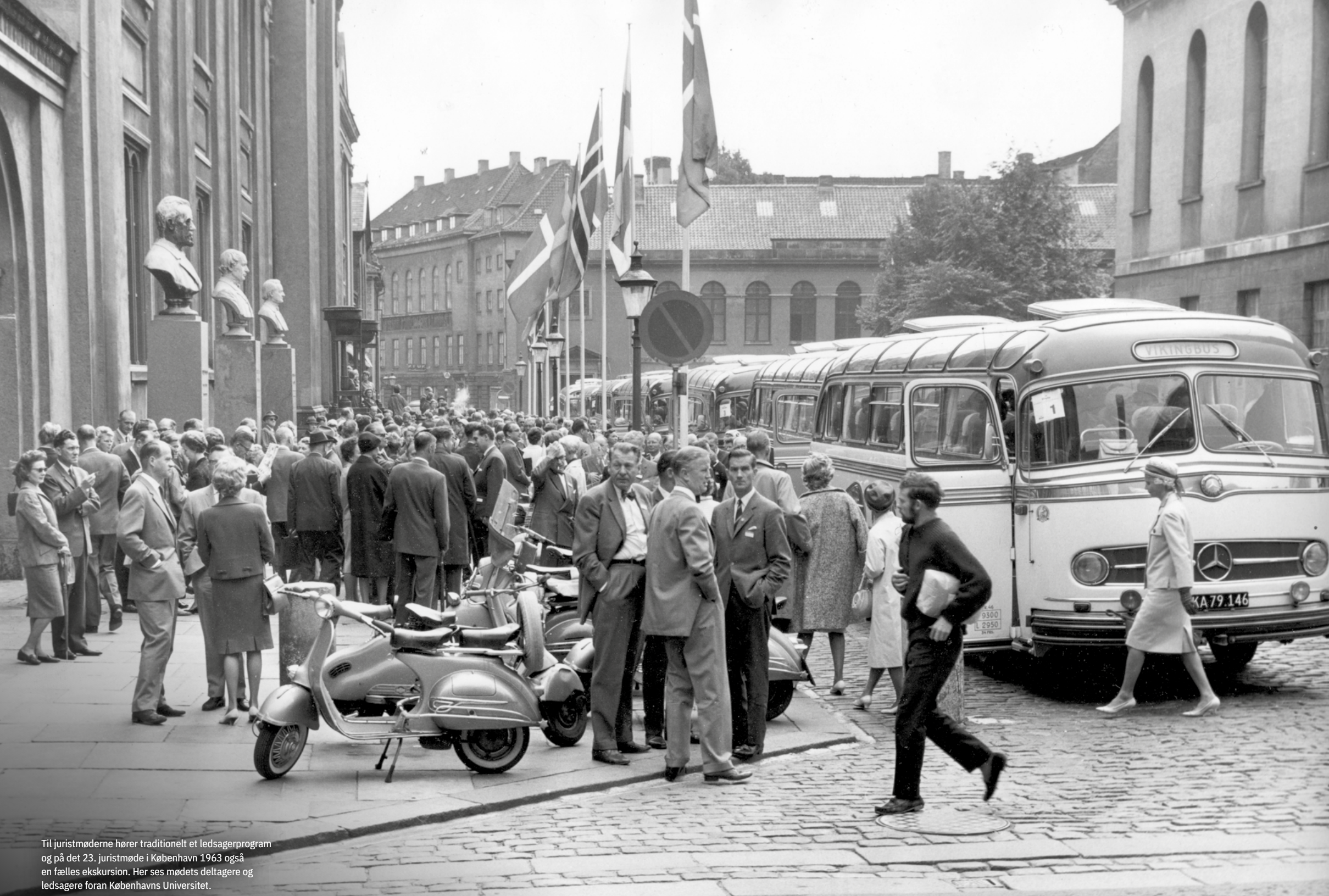
Til juristmøderne hører traditionelt et ledsagerprogram og på det 23. juristmøde i København 1963 også en fælles ekskursion. Her ses mødets deltagere og ledsagere foran Københavns Universitet.