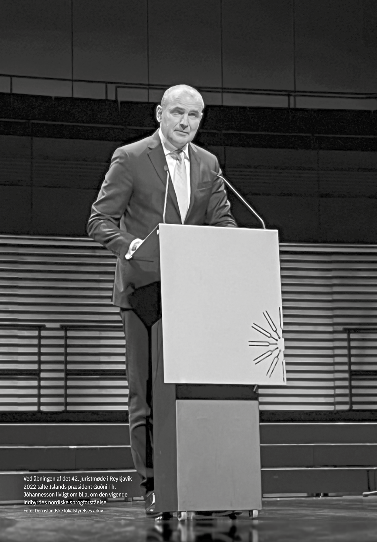
Ved åbningen af det 42. juristmøde i Reykjavik 2022 talte Islands præsident Guðni Th. Jóhannesson livligt om bl.a. om den vigende indbyrdes nordiske sprogforståelse.

ser skævt til ændringer? Og hører det måske med til historien, at love, praktiseringen og studiet af dem er en alvorens kunst og ingen spøg? 58