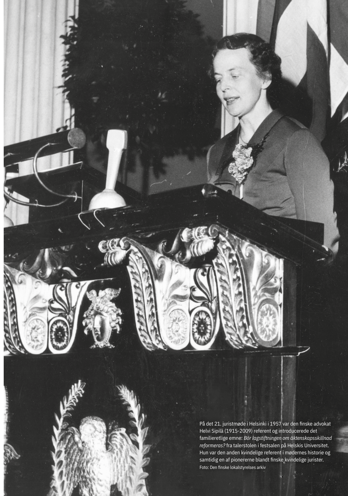
På det 21. juristmøde i Helsinki i 1957 var den finske advokat Helvi Sipilä (1915-2009) referent og introducerede det familieretlige emne: Bör lagstiftningen om äktenskapsskillnad reformeras? fra talerstolen i festsalen på Helsingfors Universitet. Hun var den anden kvindelige referent i mødernes historie og samtidig en af pionererne blandt finske kvindelige jurister.