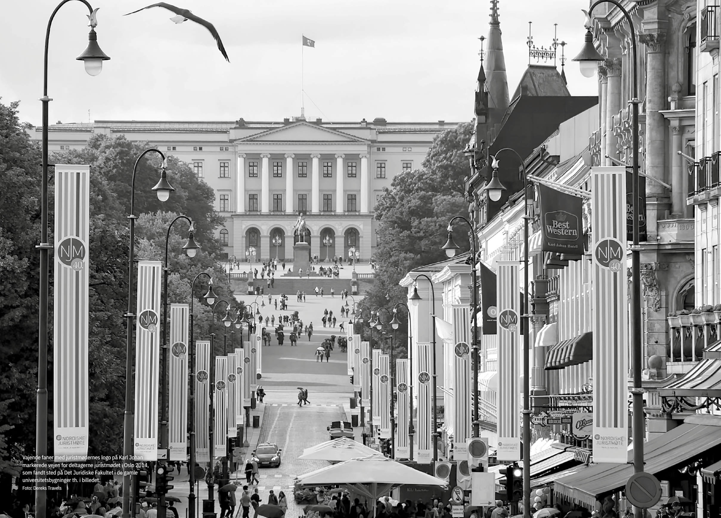
Vajende faner med juristmødernes logo på Karl Johan markerede vejen for deltagerne juristmødet i Oslo 2014, som fandt sted på Det Juridiske Fakultet i de gamle universitetsbygninger th. i billedet.