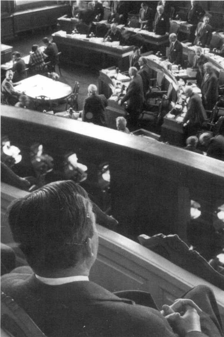
Stephan Hurwitz vælges til ombudsmand den 29. marts 1955.